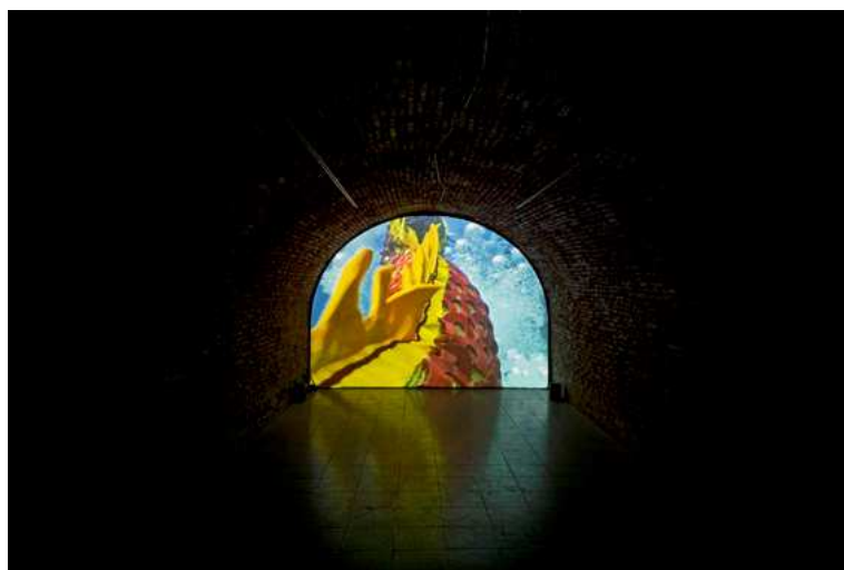
Jun Nguyen-Hatsushiba

— Exposition Jun Nguyen-Hatsushiba – Fondation Espace Écureuil – Toulouse