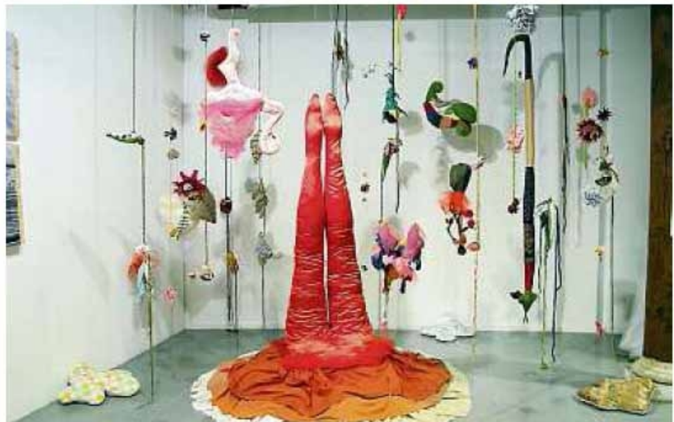
L'installation « Songes d'Aphrodite » qui a permis de remporter le prix des écoles supérieures.

Cette année, pour la 23e édition de cet événement, les élèves devaient s'inspirer de l'œuvre de la plasticienne Émilie Faïf qui a exposé dans ce même lieu à l'automne 2014. Ainsi, certaines classes se sont rendues à Toulouse pour observer ce travail et, pour les établissements les plus éloignés, ou qui ne pouvaient pas venir à Toulouse visiter l'exposition de l'artiste, ont pu participer au projet pédagogique grâce à la circulation de deux œuvres participatives et itinérantes, adaptées pour l'une au niveau primaire et pour l'autre au secondaire. Émilie Faïf a amorcé la réalisation de ces œuvres en confiant aux clas-