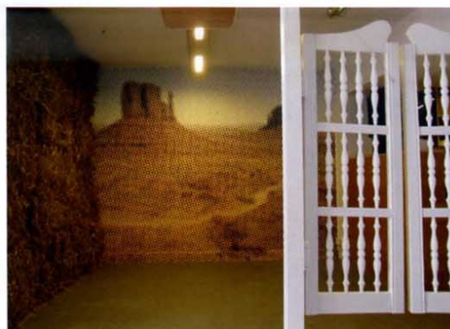
Bucking Broadway , 2013. Installation composée de : Bucking Broadway - Step Back , 2013 : impression couleur sur papier marouffé, 250 x 340 cm, vidéo (53" en boucle), sculpture (portes de saloon, châssis, charnières), paille.

Certaines œuvres d'art ne se contemplent plus, elles se vivent ! C'est le cas pour les installations de l'artiste niçoise Aïcha Hamu. Elle plante des décors éphémères dans des lieux d'exposition, prenant en compte l'espace qui lui est consacré. Elle s'inspire le plus souvent de la littérature et invite le spectateur à activer son imagination. Pour sa nouvelle exposition, c'est dans le Dictionnaire des lieux imaginaires d'Alberto Manguel qu'elle puise son inspiration. Au travers de ses installations, elle propose aux visiteurs de déambuler dans des décors reconstitués, issus du cinéma ou dépeints dans des livres : le village d'Innsmouth décrit par Lovecraft dans une de ses nouvelles fantastiques, la chambre de l'inquiétant Bates Hotel