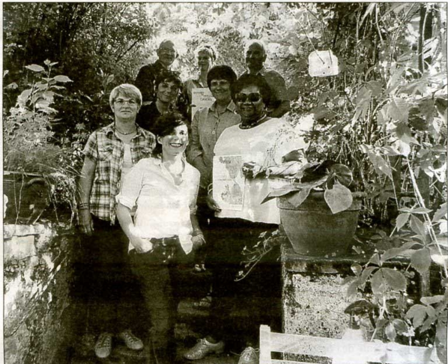
Toute l'équipe pilote du festival CJJ dans son Jardin